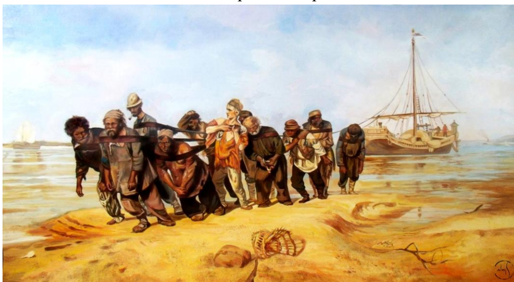
И.Репин Бурлаки на Волге

Самые известные художники-реалисты Среди живописцев, создававших свои произведения в реалистичной манере есть много достойных мастеров. И все же, среди самых известных художников-реалистов особо выделяются: Густав Курбе — основоположник современной реалистичной живописи, многие картины которого вызвали негативную реакцию не только критиков, но и значительной части французского общества. Илья Репин — один из величайших русских художников всех времен, непревзойденный отечественный мастер портретного, бытового и исторического жанров. Эдвард Хоппер (Edward Hopper) — крупнейший представитель американского реализма, автор множества картин с изображением сцен из жизни обычных жителей США. Томас Уильям Робертс (Thomas William Roberts) — австралийский живописец, один из основателей Гейдельбергской школы, воспеватель быта сельских жителей родной страны.